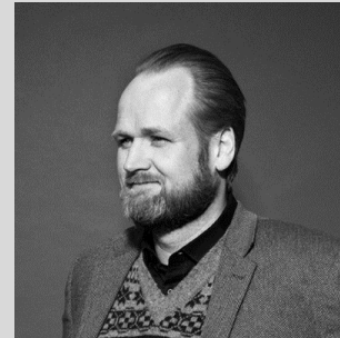
Ask Agger CEO Workz